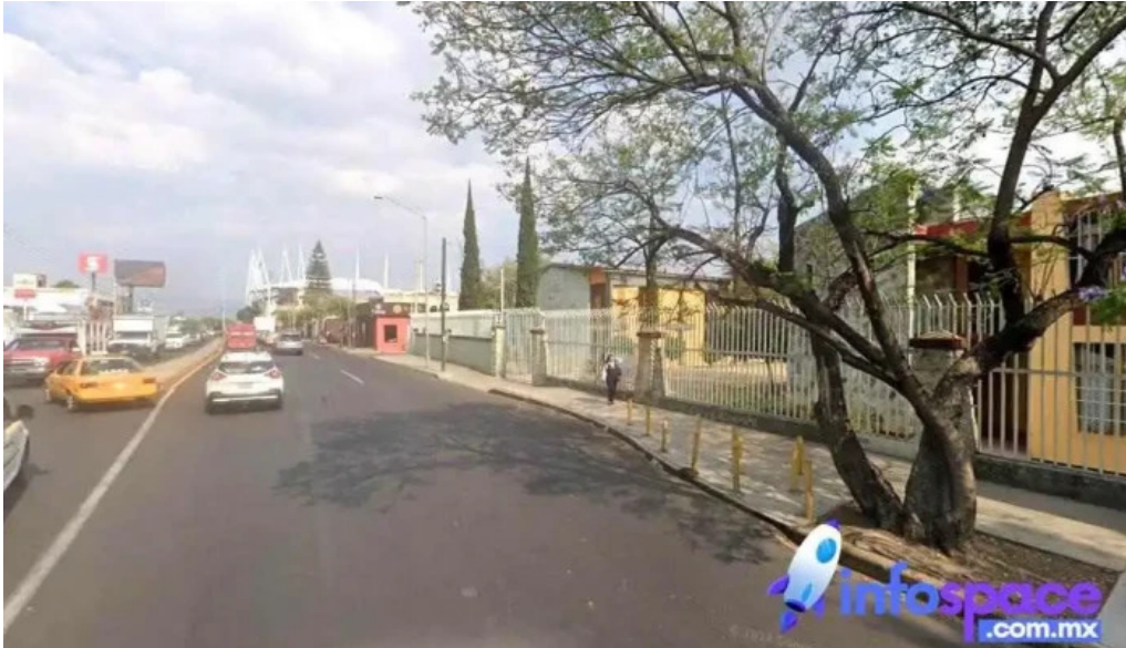
Legal global consulting oaxaca de juarez