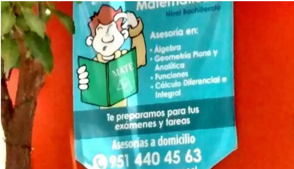
Asesorías de matemáticas como llegar