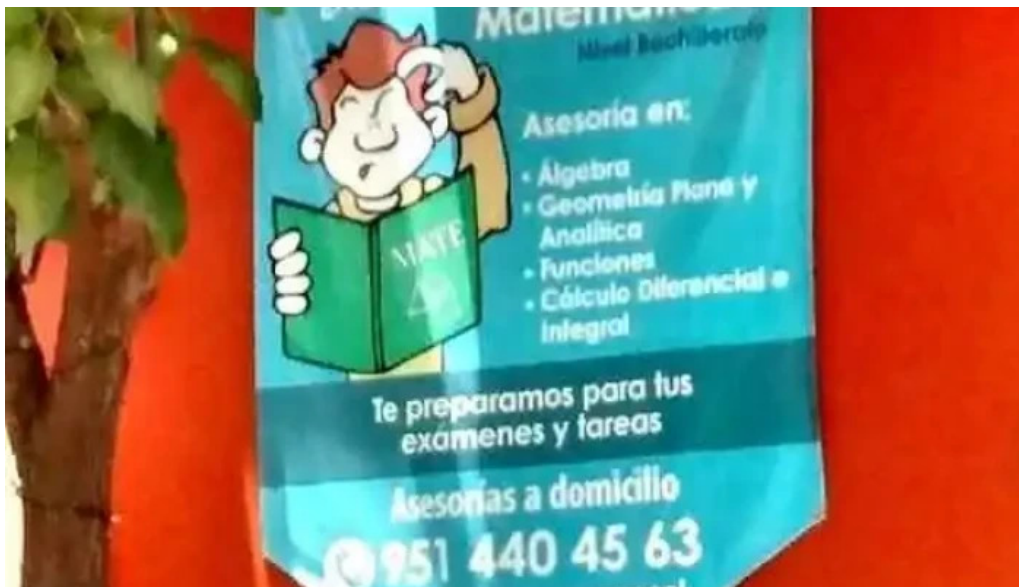
Asesorías de matemáticas el rosario