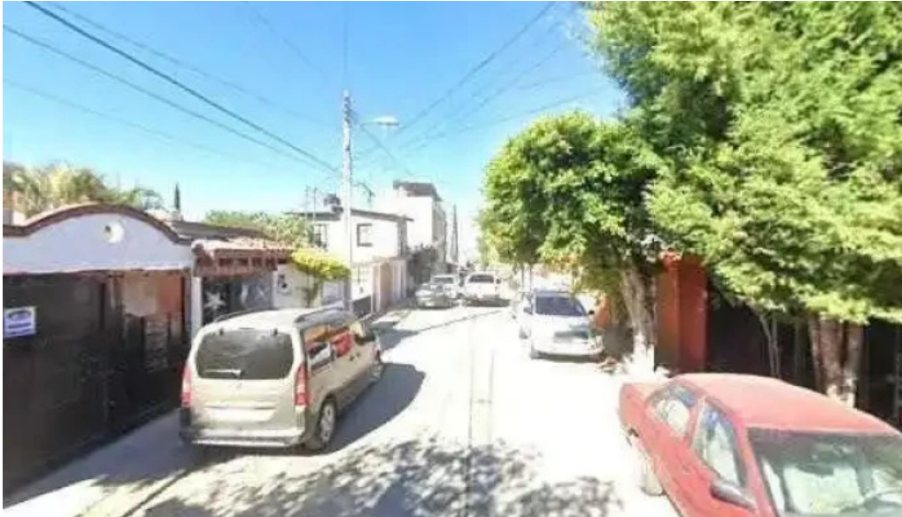
Asesorías de matemáticas como llegardeg