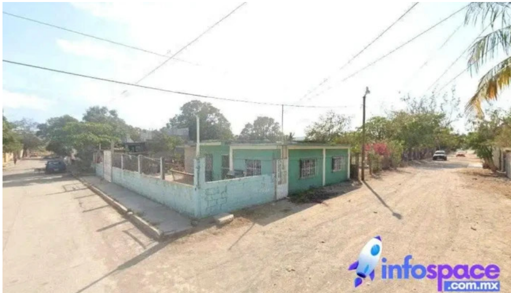
Asesoramiento pedagogico liberador salina cruz