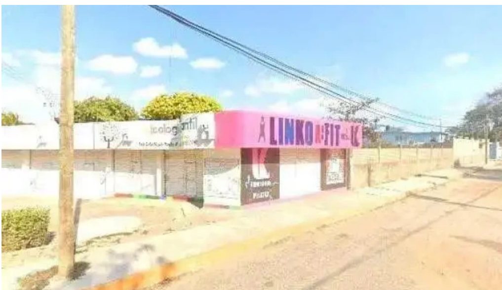
Gestorias sep oaxaca puntajedeg