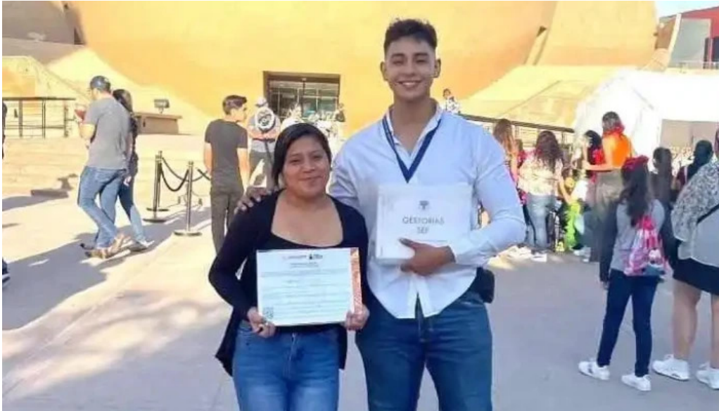
Gestorias sep oaxaca puntaje