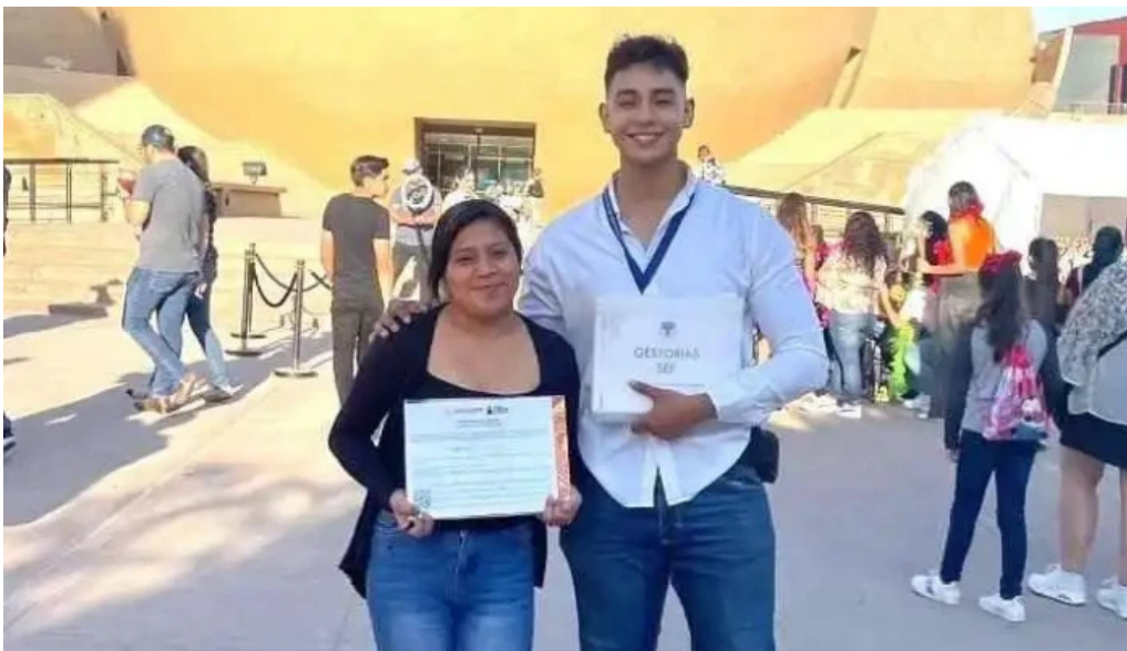
Gestorias sep oaxaca salina cruz