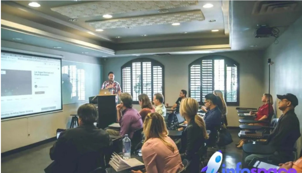
Sipropa consultores cdad lopez mateos