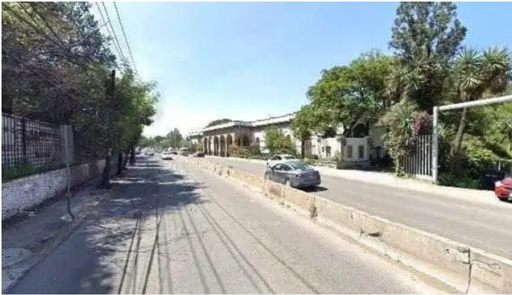
Siproba consultores como llegardeg