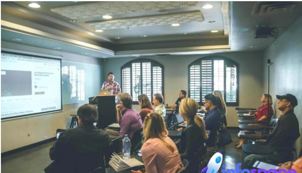
Siproba consultores como llegar