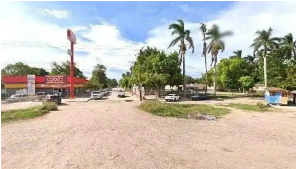
Grupo financiero banorte corresponsal bagojo Imm comentarios