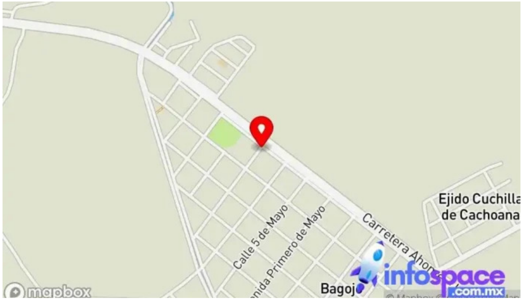
Grupo financiero banorte corresponsal bagojo Imm mapa