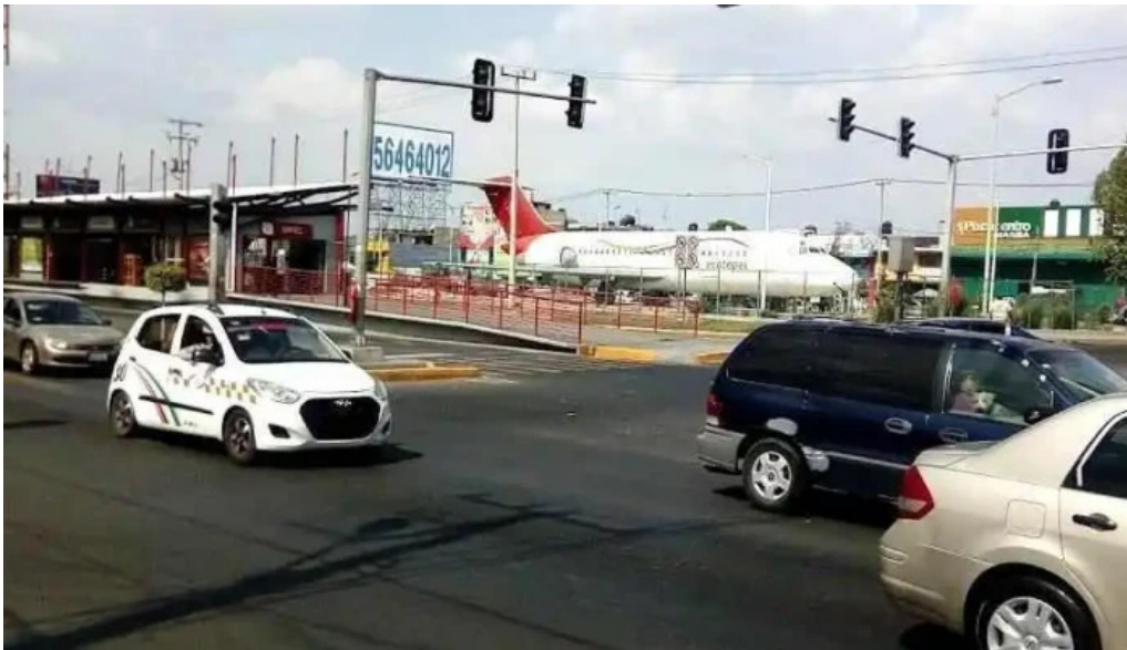
Unitec ecatepec de morelos