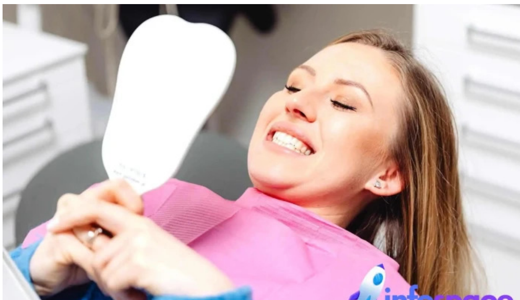
Dental home diente