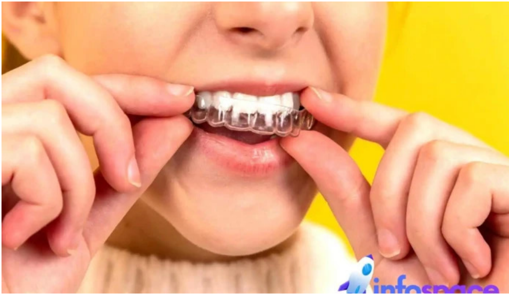
Dental home nuevo casas grandes