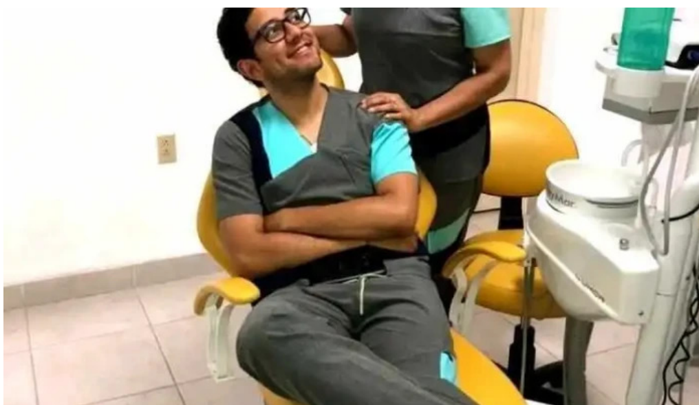
Dental home del propietario