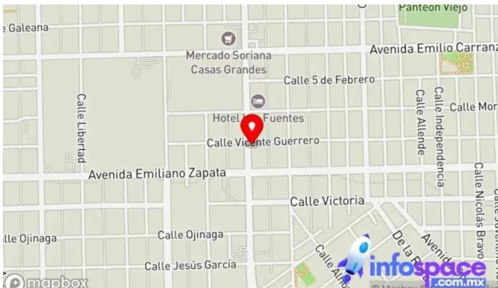
Dental home mapa