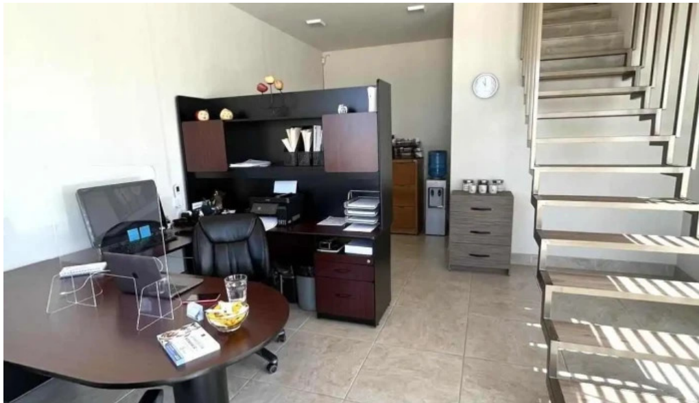
Ceda seguros casas grandes catalogo