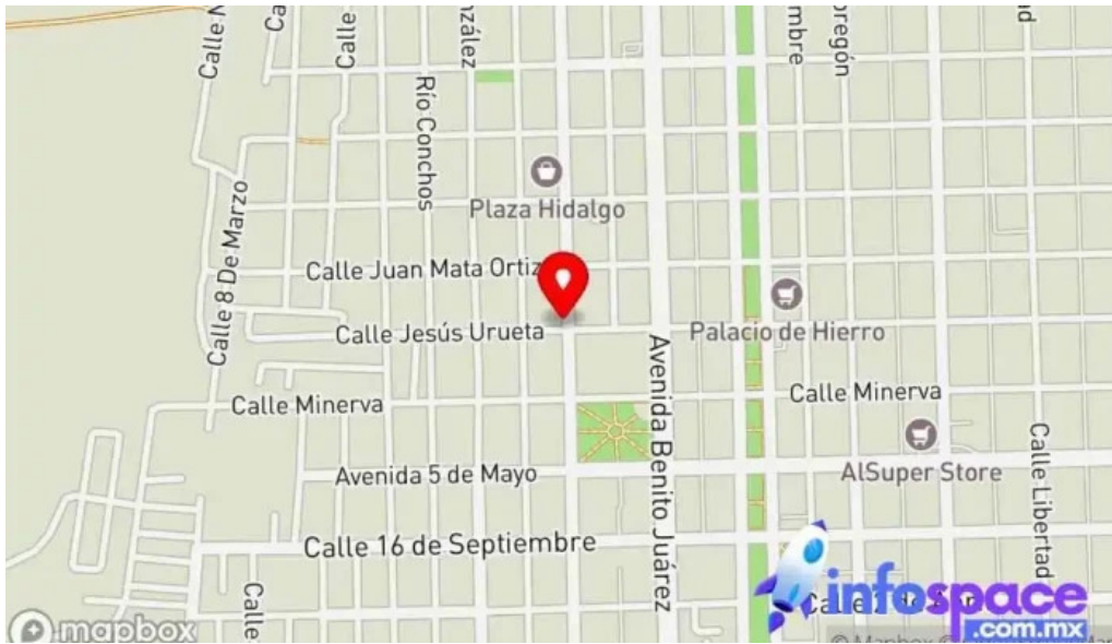
Ceda seguros casas grandes mapa