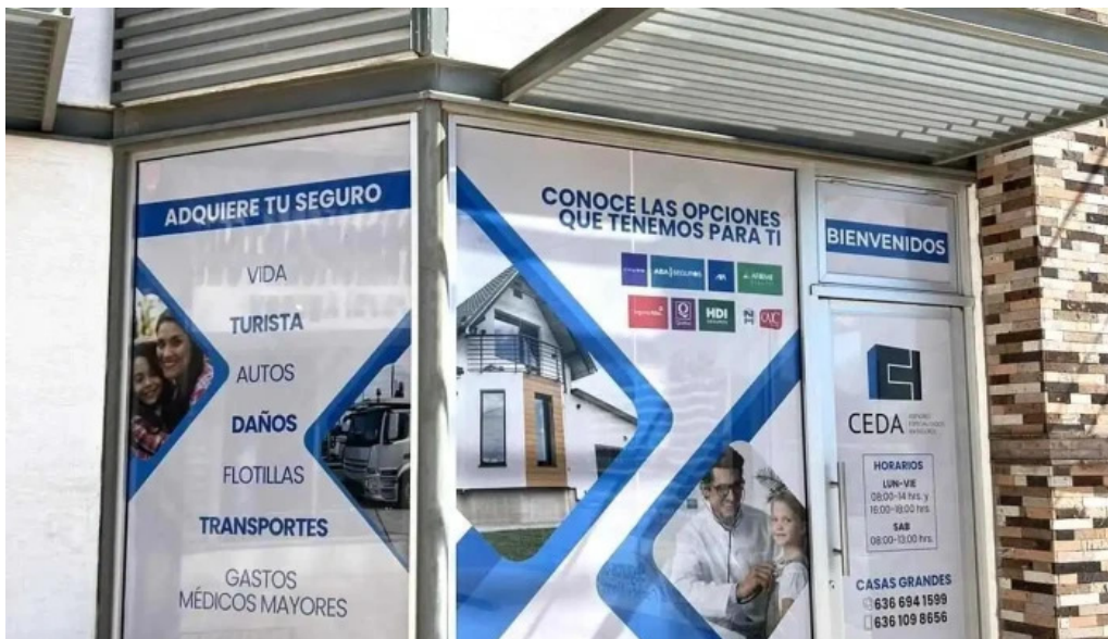
Ceda seguros casas grandes del propietario