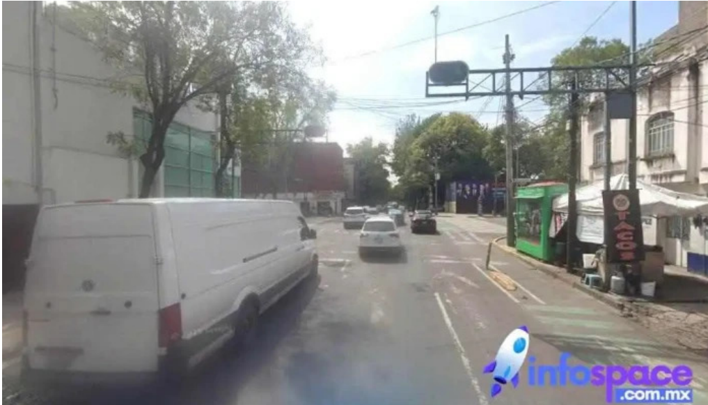
Grupo consultoria informatica integral s a de c v cuauhtemoc ciudad de mexico