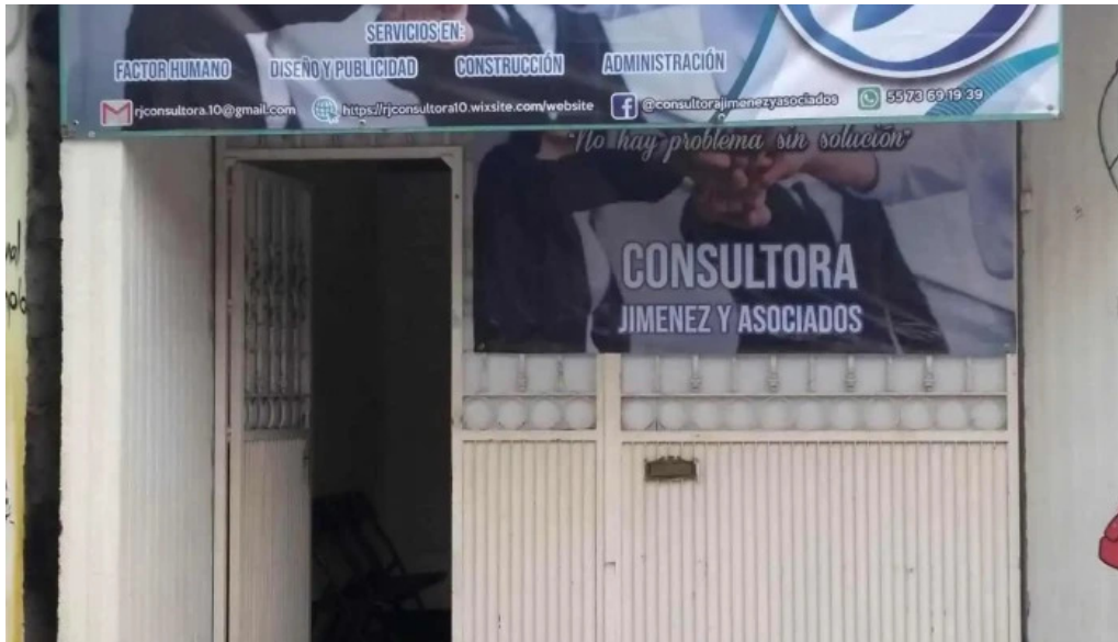
Consultora jimenez y asociados ubicacion