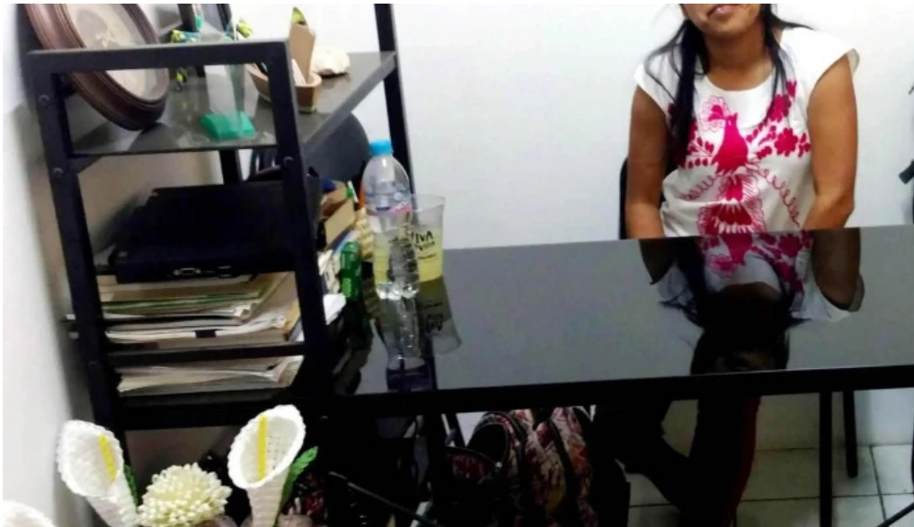
Consultora jimenez y asociados heroica cdad de huajuapán de león