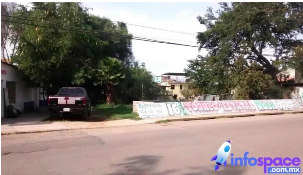
Consultoria fiscal especializada santa lucia del camino