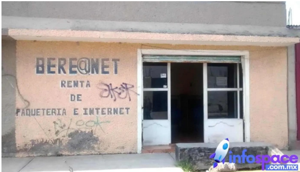
Consultoria sii chimalhuacan