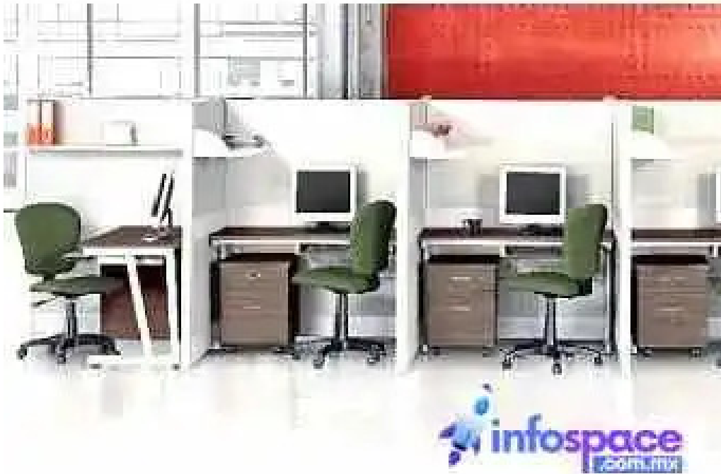
Grupo malga soluciones en ti del propietario