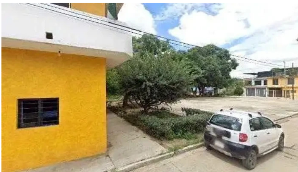
Tecoatl asesoria ambiental y soluciones alternativas sa de cv horario