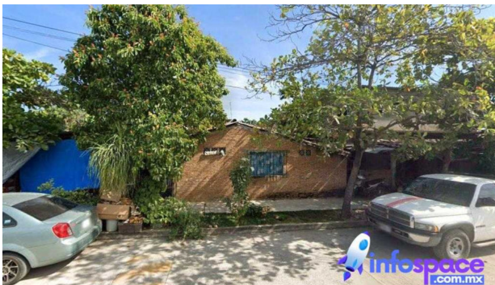
Ciberspacio de tecnologías rio grande o piedra parada