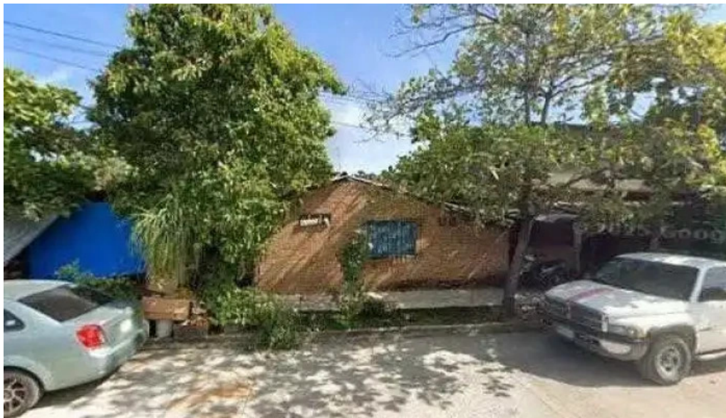
Ciberspacio de tecnologías videos