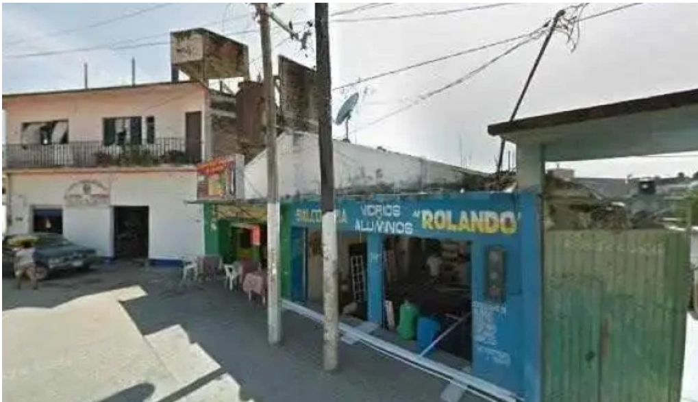
Conta solution asesoria contable fiscal imss e infonavit fotos