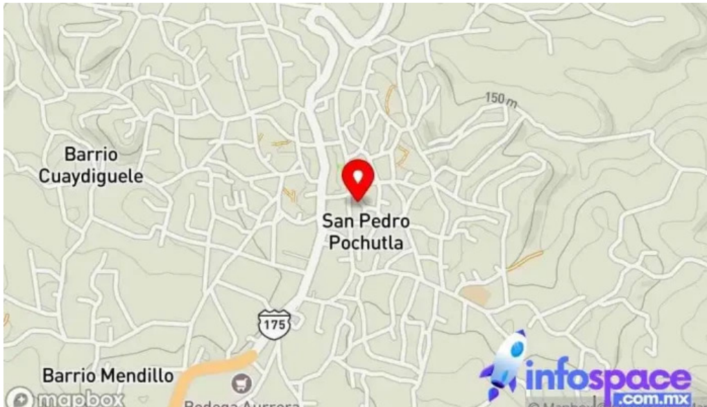
Conta solution asesoria contable fiscal imss e infonavit mapa