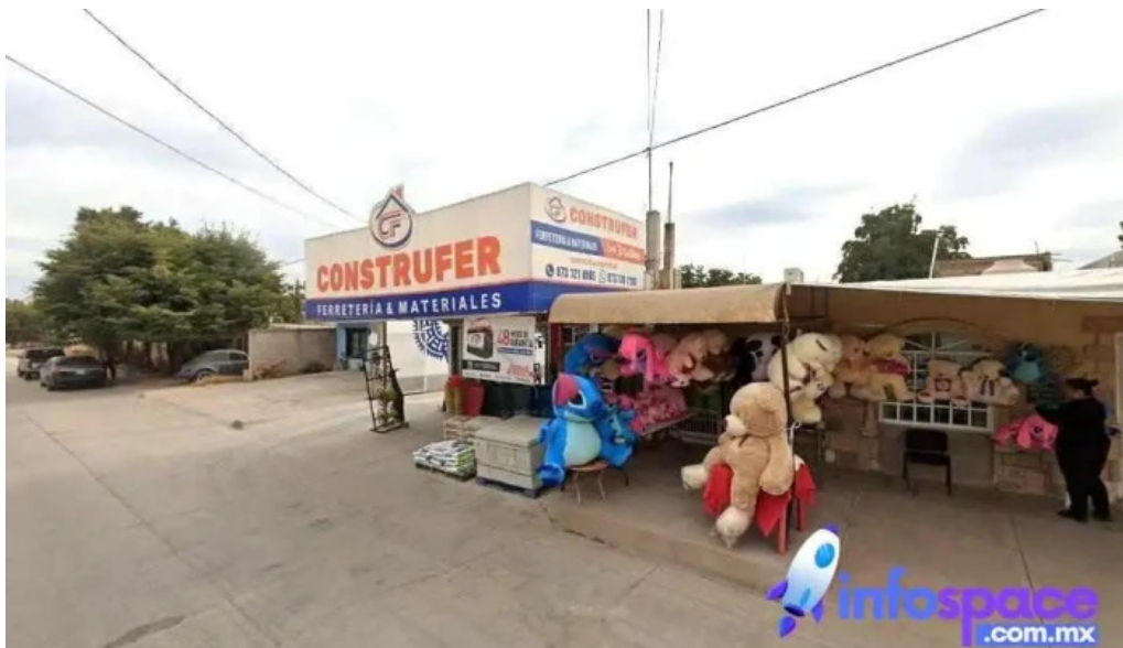
Consultores canvyr guamuchil