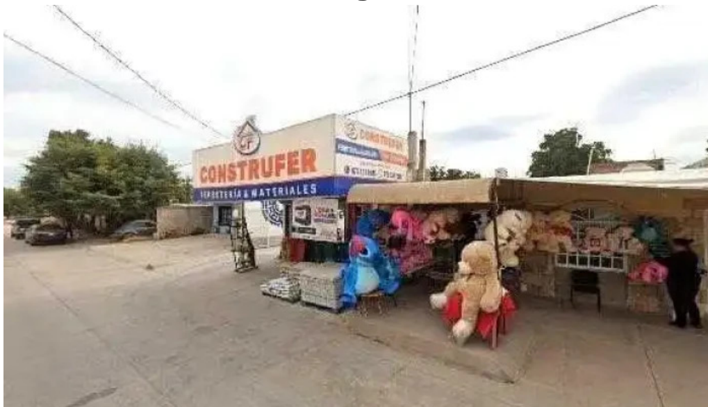
Consultores canvyr telefono