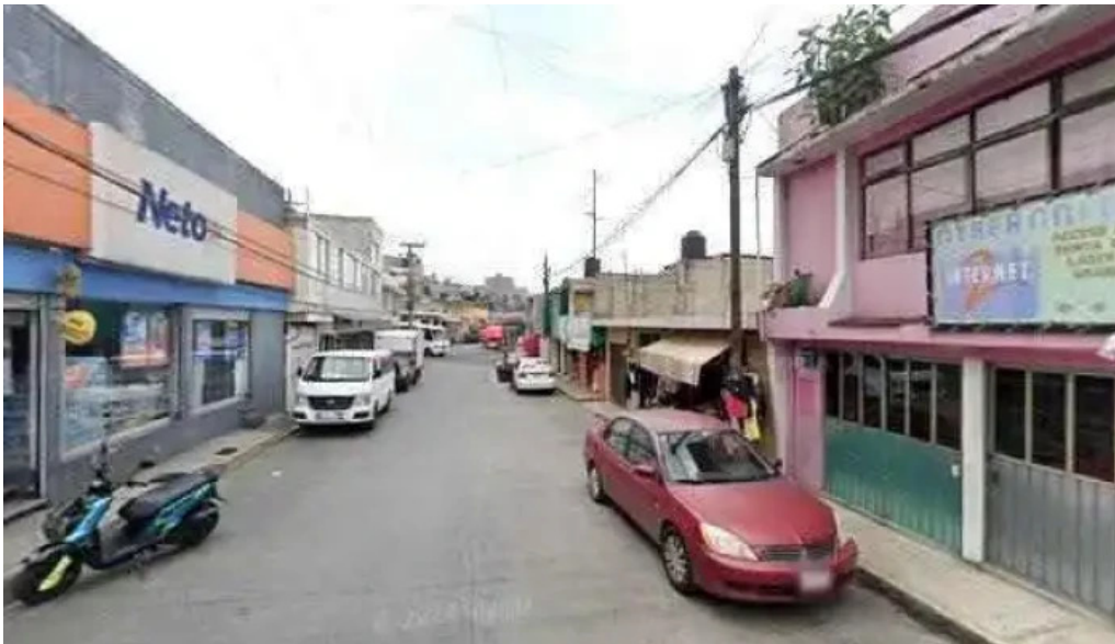
Consultora it cerca de mi