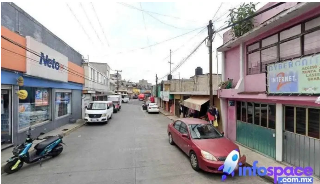
Consultora it cdad lopez mateos