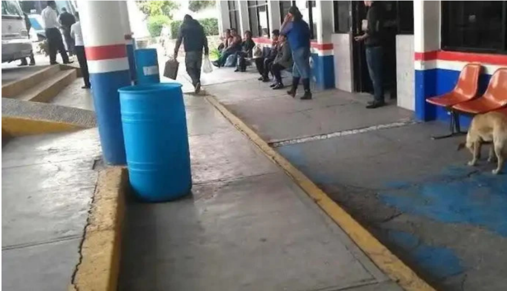
Terminal de autobuses teotihuacanos apan