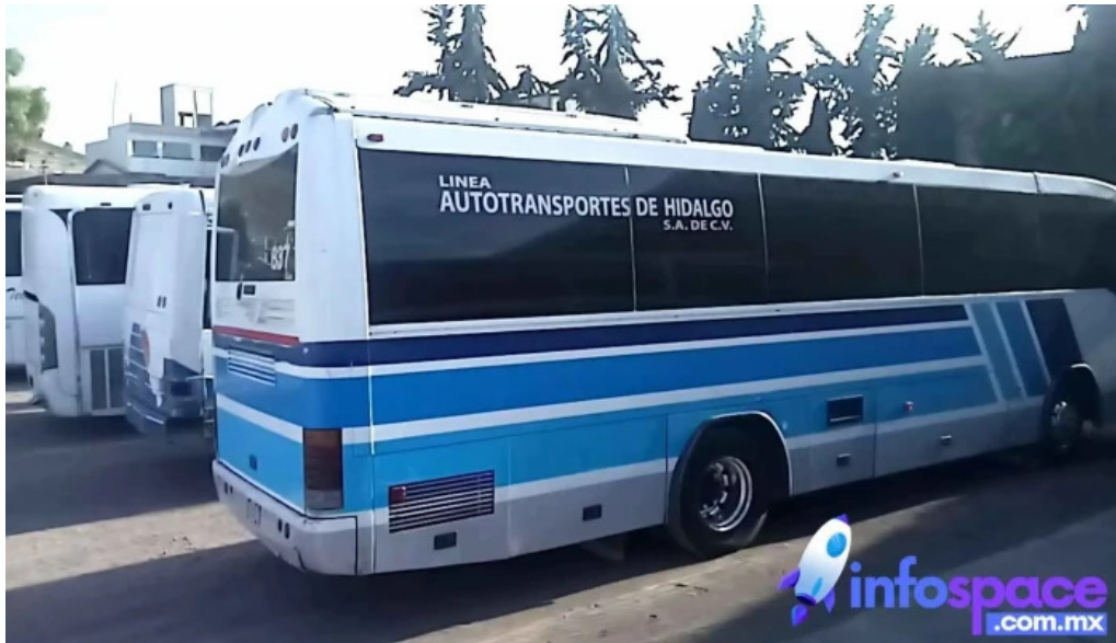
Terminal de autobuses teotihuacanos videos