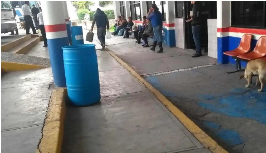
Terminal de autobuses teotihuacanos descuentos