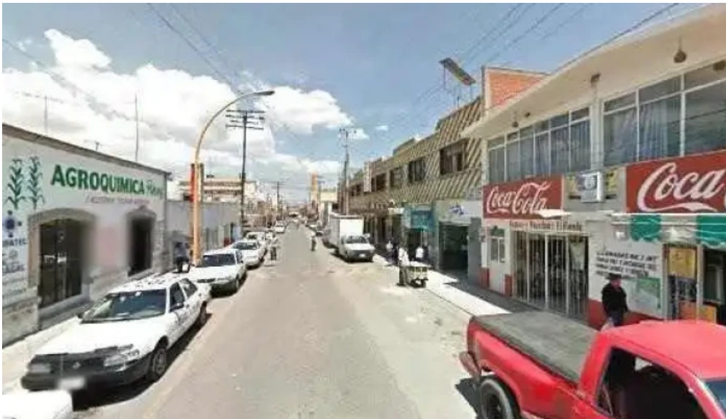
Terminal de autobuses teotihuacanos descuentosdeg