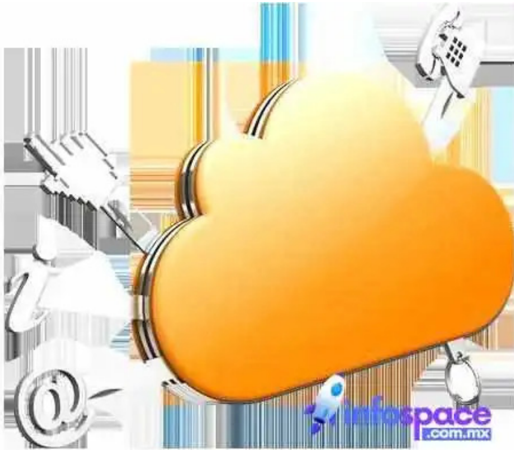
Wise interactions sa de cv del propietario