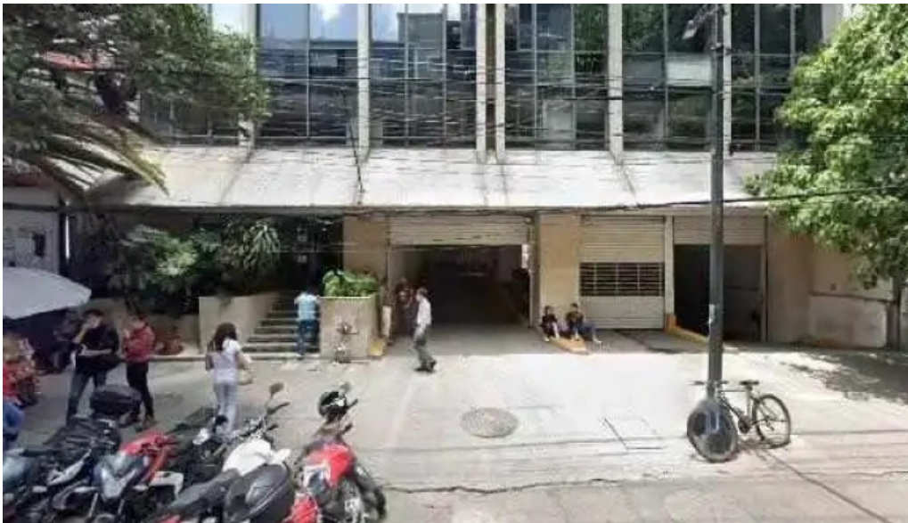
Wise interactions sa de cv direccion