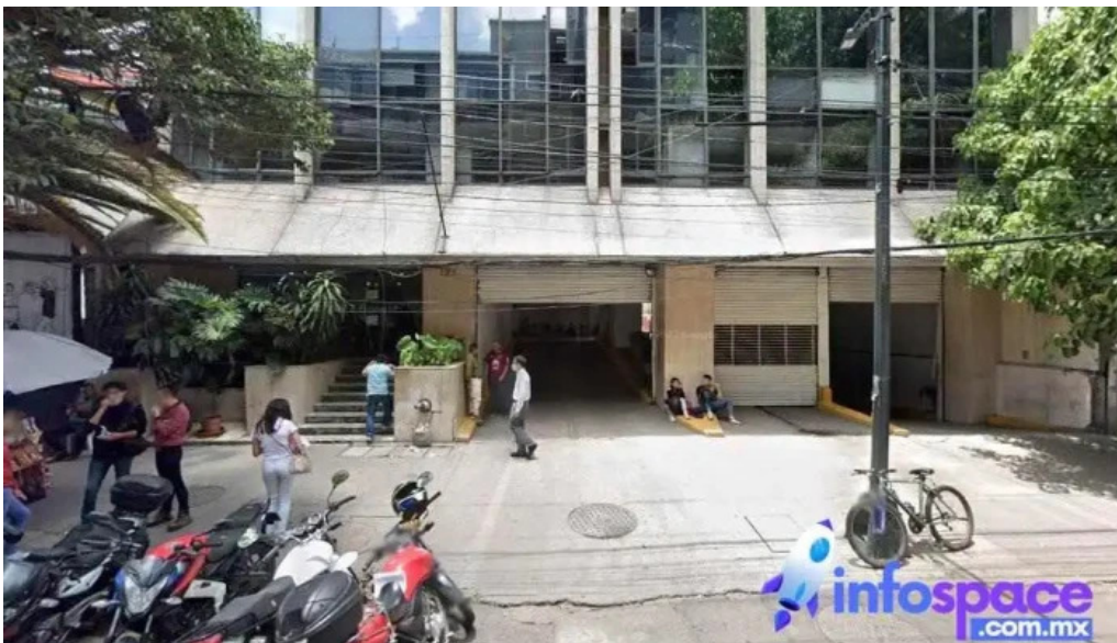
Wise interactions sa de cv cuauhtemoc ciudad de mexico