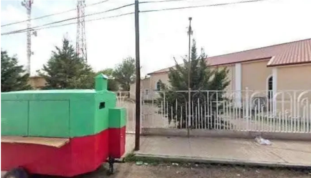
Primaria oscar soto maynez fotos