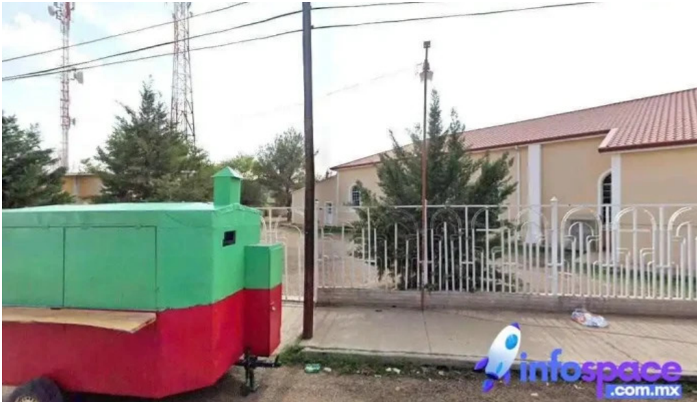
Primaria oscar soto maynez santa ana