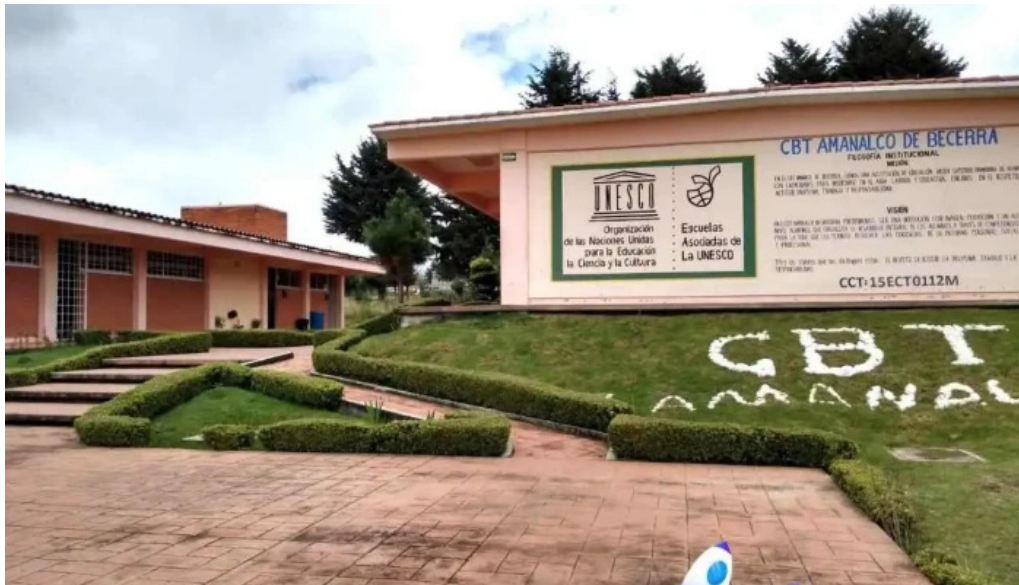
Cbt amanalco de becerra estado de mexico