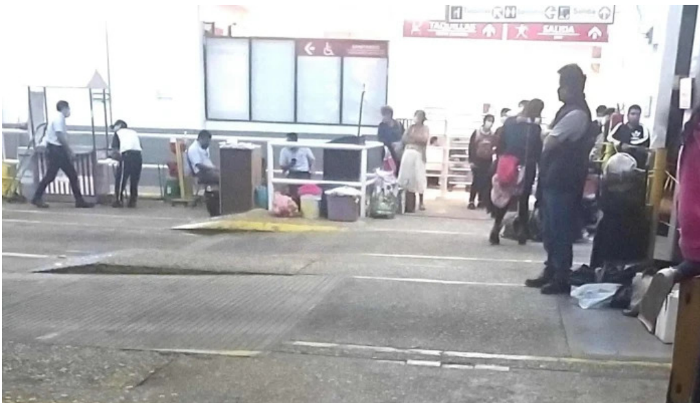
Terminal sur minatitlan