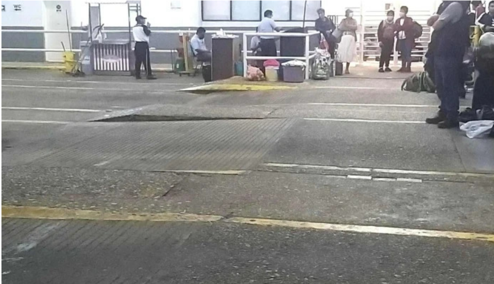
Terminal sur videos