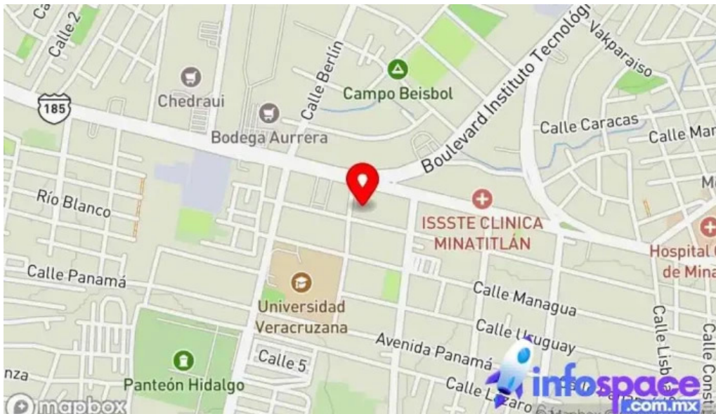
Terminal sur mapa