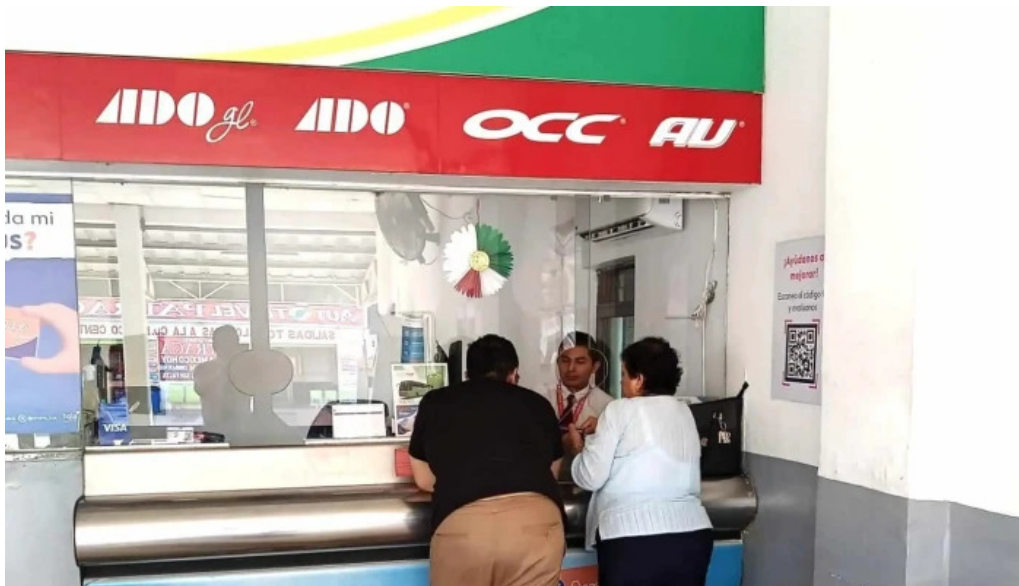
Terminal sur comentarios