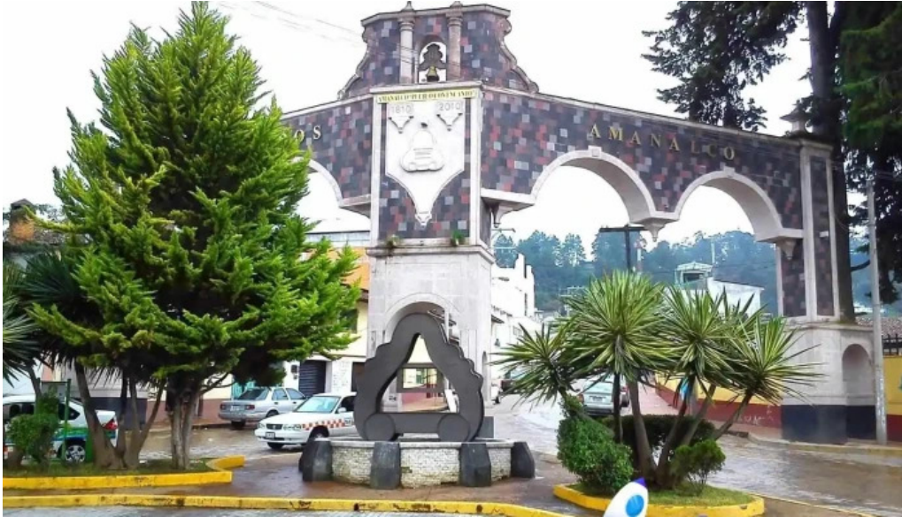
Turismo amalco videos