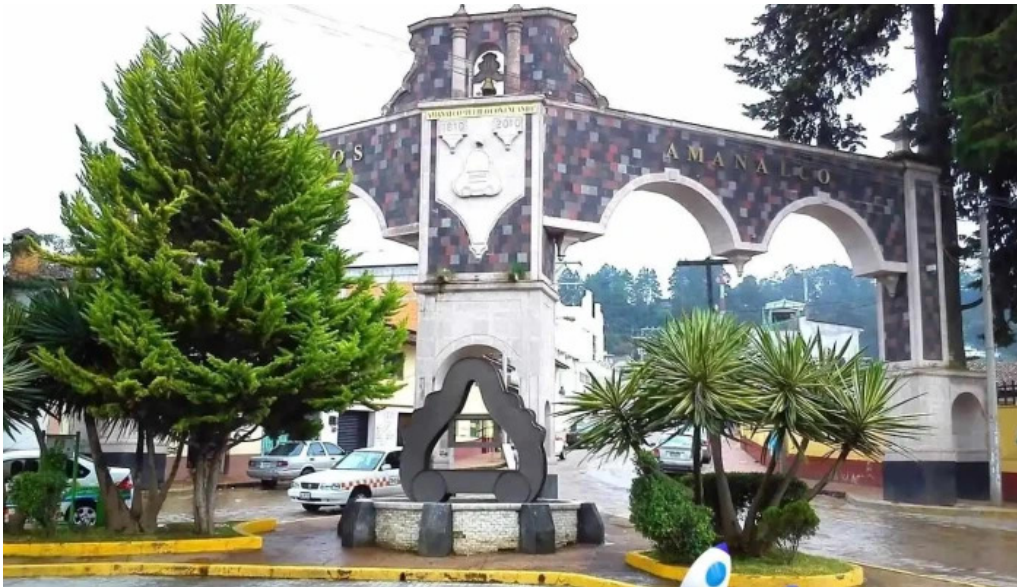
Turismo amalco estado de mexico