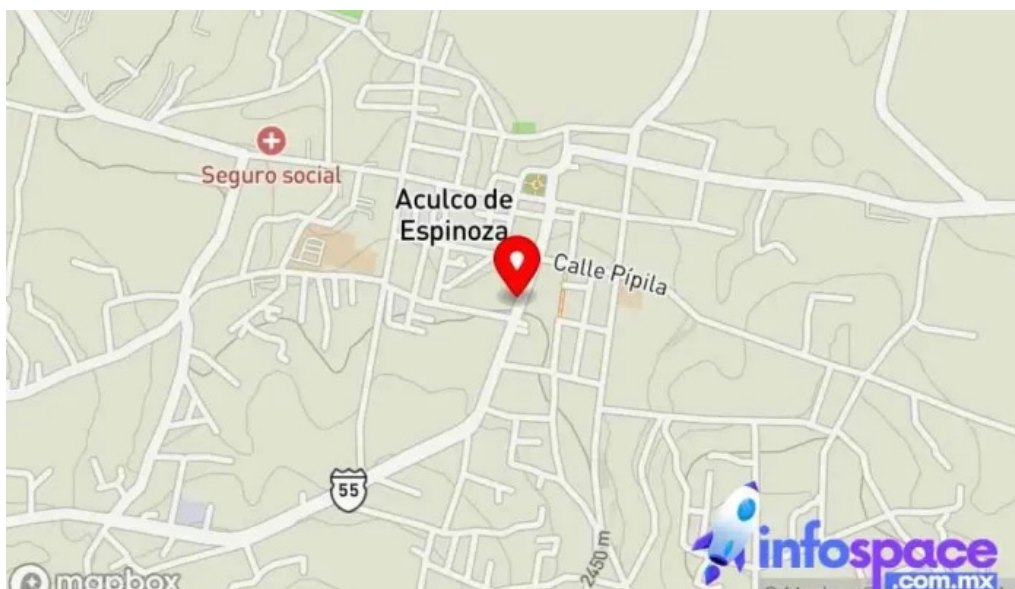
Laboratorio clinicos y medicina especializada mapa