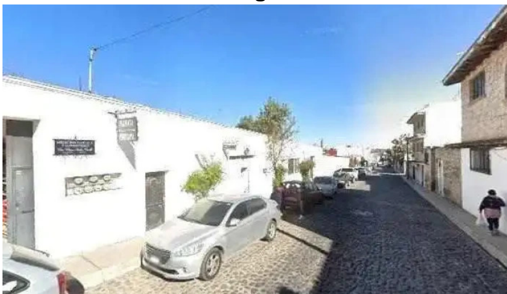
Laboratorio clinicos y medicina especializada opiniones