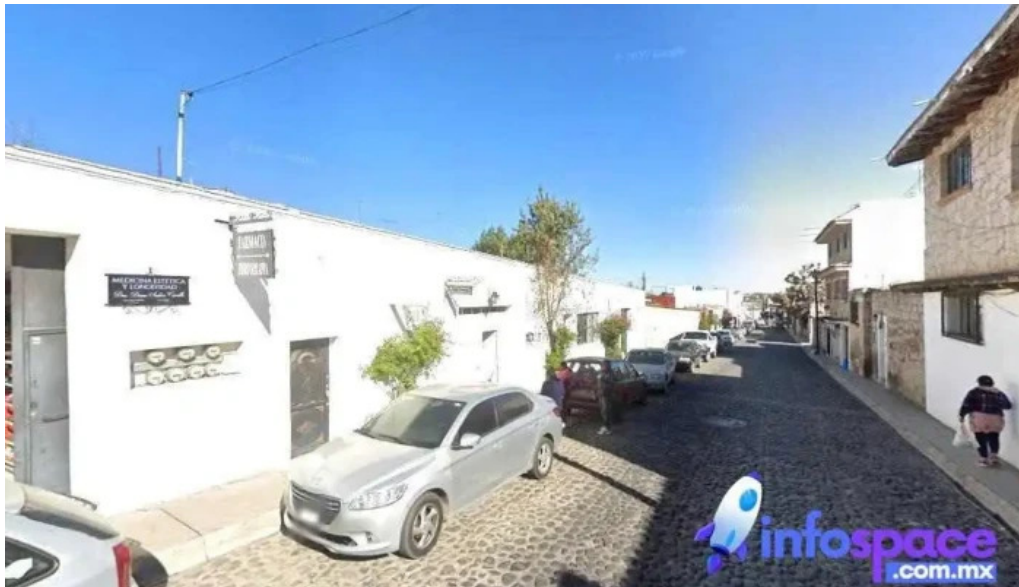
Laboratorio clinicos y medicina especializada aculco de espinoza