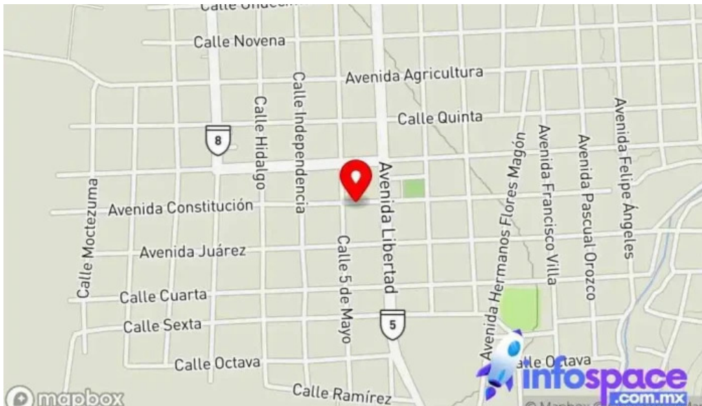
Asesoría cmg gomez farias mapa