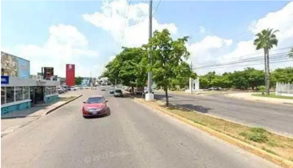
Gya consultores descuentos