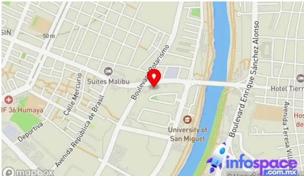
Gya consultores mapa