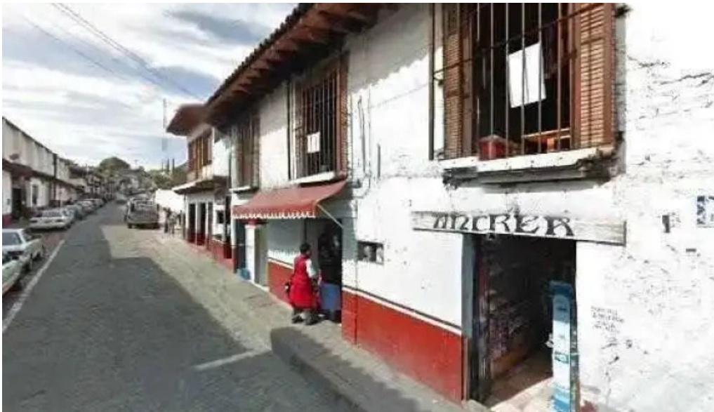
El arco valle de bravo promocion