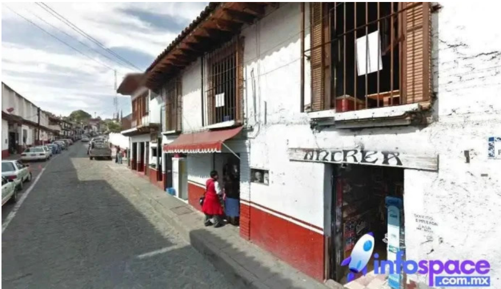
El arco valle de bravo valle de bravo