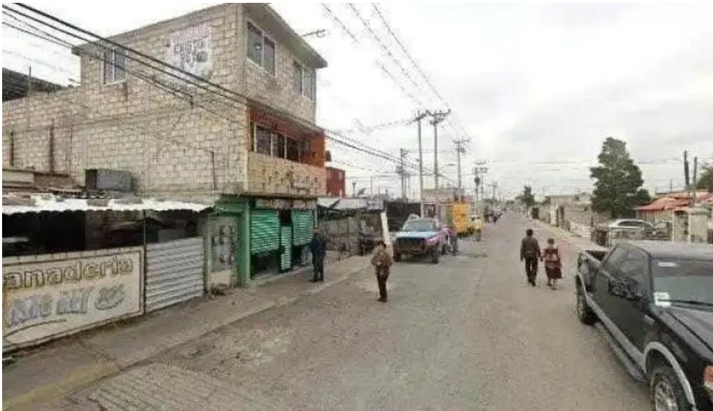
Finca tlanemani instagram