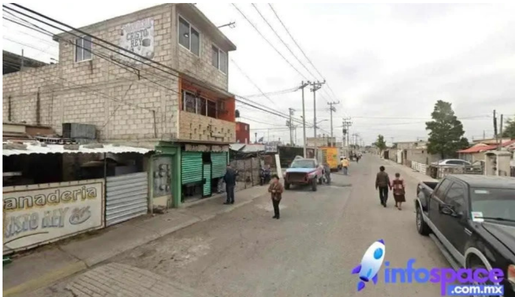
Finca tlanemani zumpango de ocampo