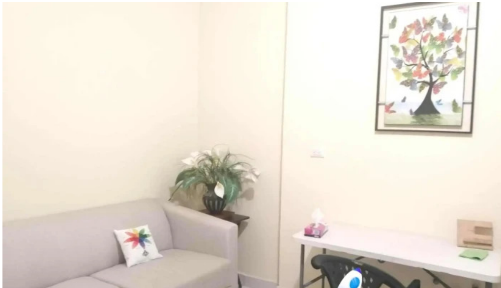
Libera centro terapeutico catalogo