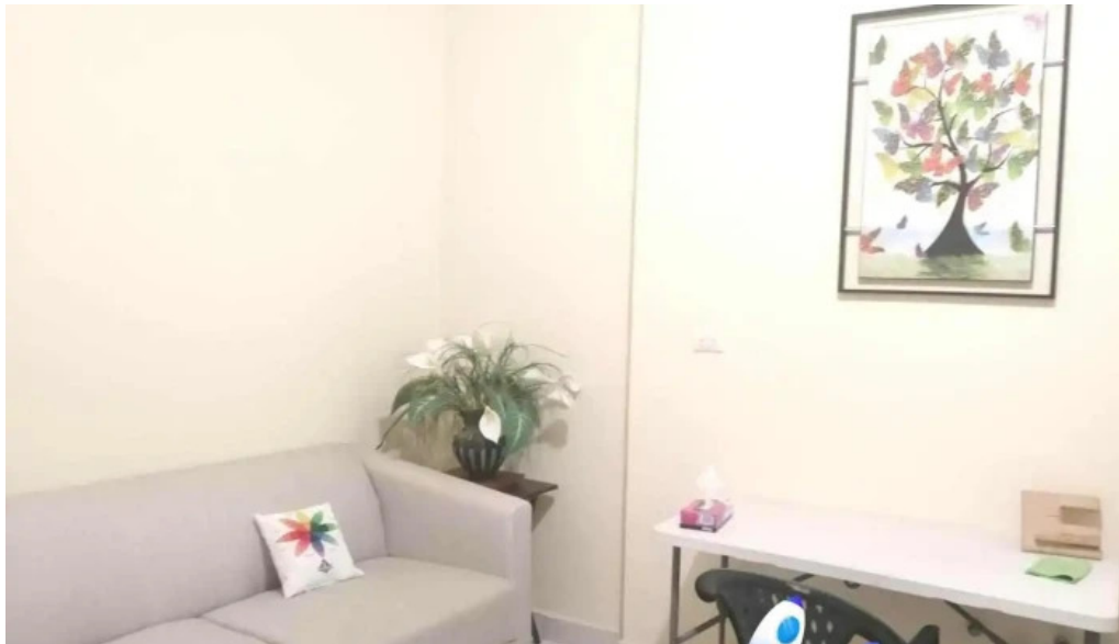
Libera centro terapeutico pedro meoqui