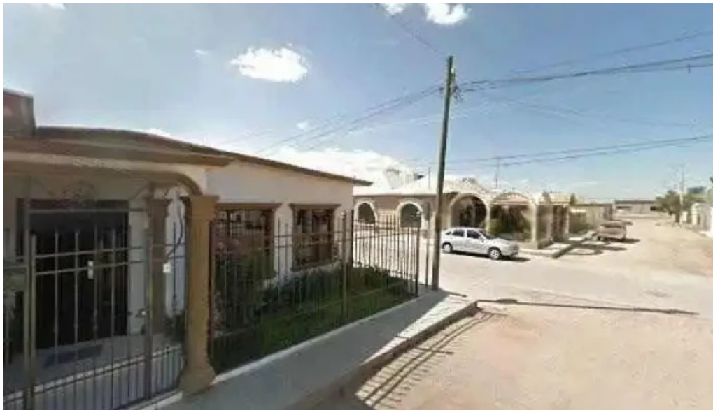
Libera centro terapeutico catalogodeg