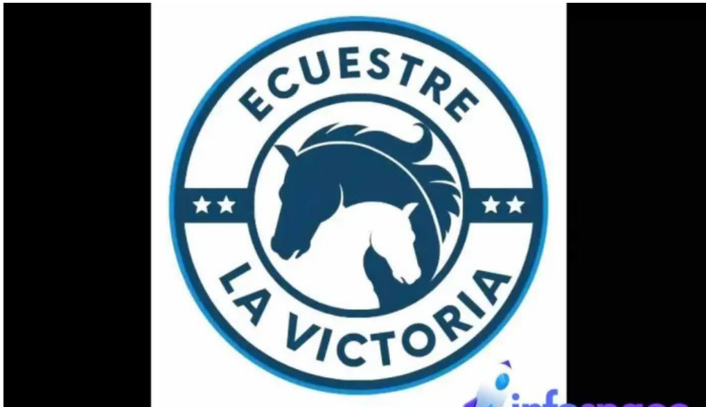
Libera centro terapeutico del propietario