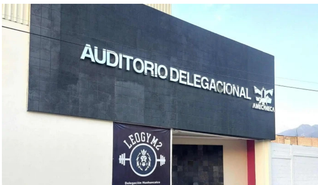
Auditorio delegacional san diego huehuecalco san diego huehuecalco