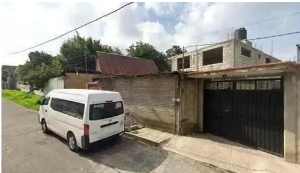
Auditorio delegacional san diego huehuecalco videos