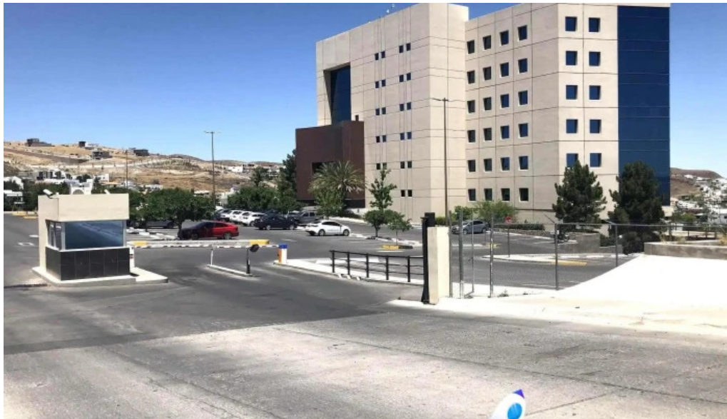
Asesoría corporativa legal tesac exterior