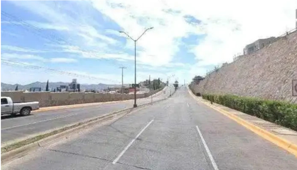
Asesoría corporativa legal tesac telefono