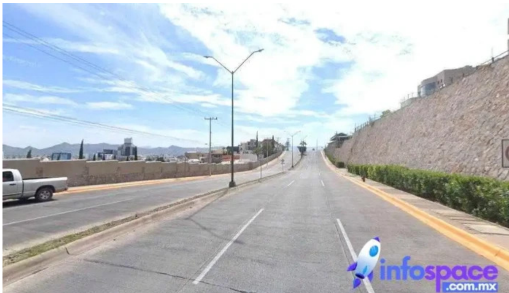
Asesoría corporativa legal tesac chihuahua