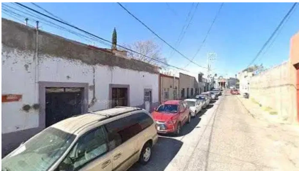
Consultoria legal y fiscal comentarios