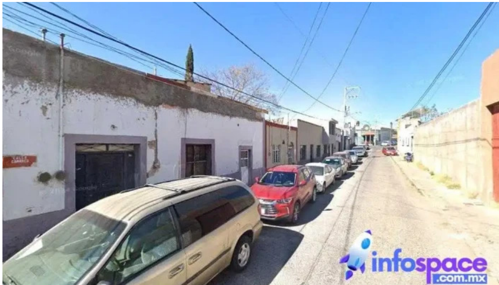
Consultoria legal y fiscal hidalgo del parral