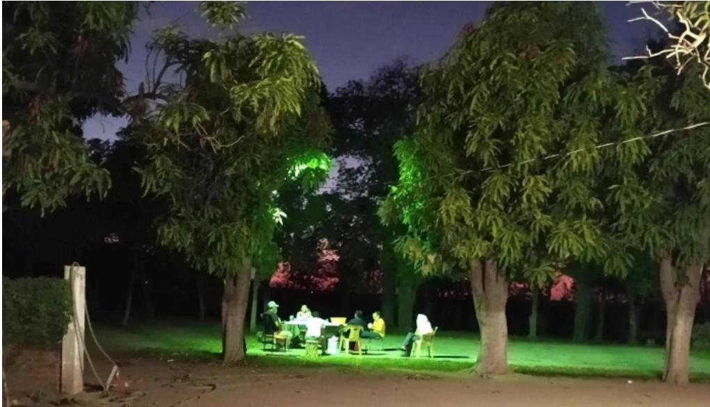
Lo de Jesus campo romero sinaloa videos