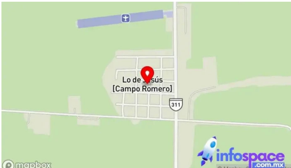
Lo de Jesus campo romero sinaloa mapa