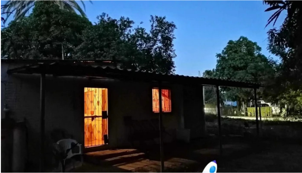
Lo de jesus campo romero sinaloa exterior