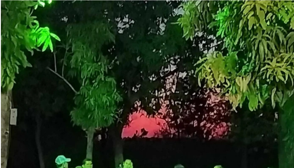
Lo de Jesus campo romero sinaloa campo romero lo de Jesus