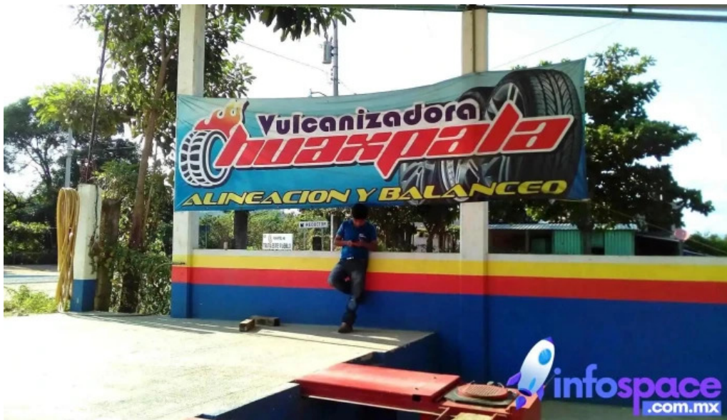
huaxpala alineacion balanceo cambio de piezas de suspencion llantas nuevas y reparacion de llantas san andre