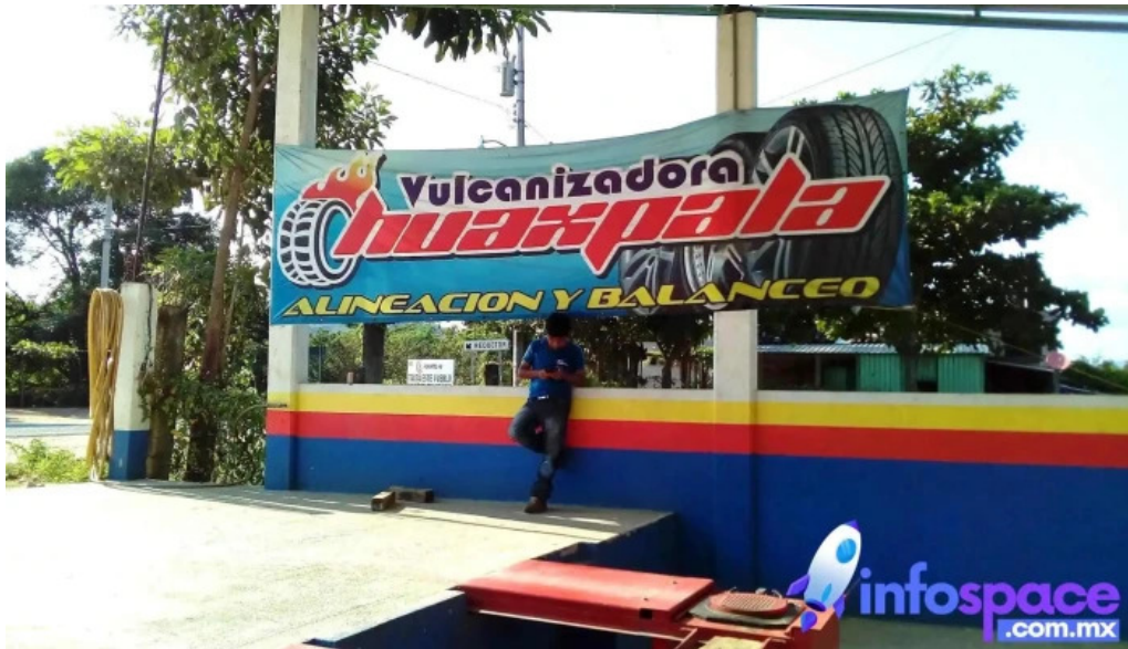
izadora huaxpala alineacion balanceo cambio de piezas de suspencion llantas nuevas y reparacion de llantas te