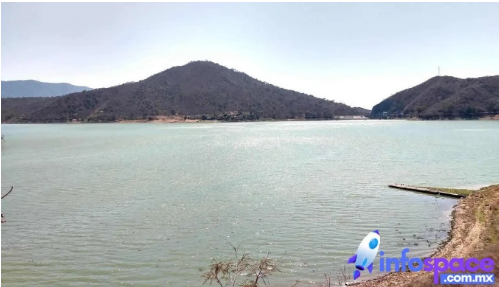
El arco playa