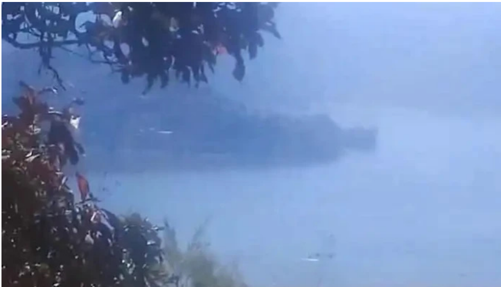
El arco cerca de mi