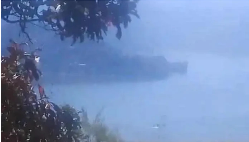
El arco el arco